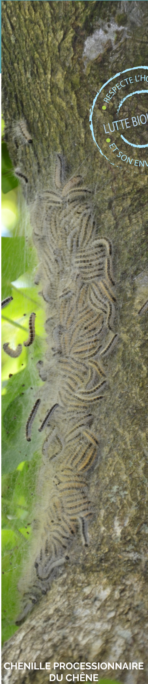
CHENILLE PROCESSIONNAIRE DU CHÊNE